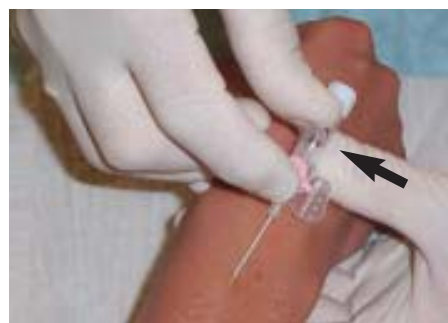
▲ Abb. 3: Schieben Sie die Braunüle in einem flachen Winkel weiter vor. Wenn Blut in der Nadelkappe erscheint, steckt die Nadelspitze ...