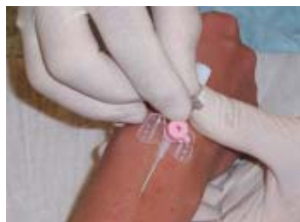
▲ Abb. 4: ... in der Vene. Jetzt müssen Sie die Braunüle noch eine Winzigkeit vorschieben, damit auch die Kanüle sicher in der Vene sitzt.