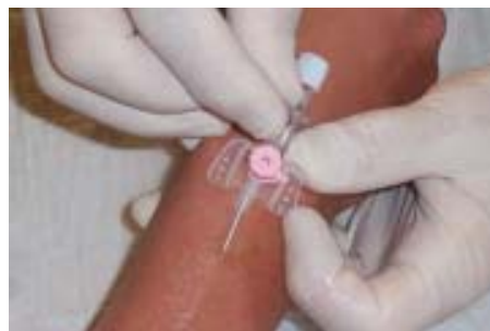
▲ ☒ Abb. 5: Vorsicht: Schieben Sie die Braunüle nicht zu weit, sonst stechen Sie durch die Vene! Die Nadel wird in ihrer Position fixiert und ...