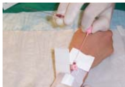
▲ Abb. 8: Zuletzt wird die Nadel entfernt und durch einen Mandrin oder einen Infusionsanschluss ersetzt.