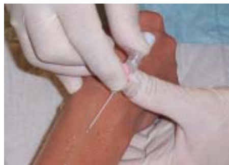
▲ ☒ Abb. 1: Fassen Sie die Braunüle zwischen Daumen und Zeigefinger und/oder Mittelfinger und zielen Sie auf die Punktionsstelle.