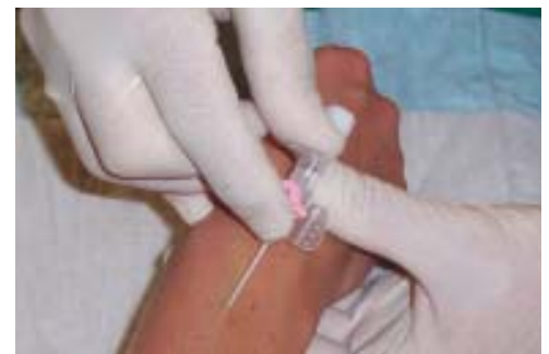
▲ ☒ Abb. 2: Mit dem Daumen der anderen Hand spannen Sie die Haut über der Punktionsstelle und stechen in einem Winkel von 40 Grad durch die Hautoberfläche.