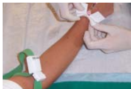
▲ Abb. 7: Der Stauschlauch wird gelöst. Die Braunüle fixieren Sie am besten mit einem speziellen, vorgefertigten Braunülenpflaster.