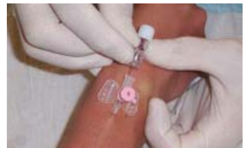
▲ ☒ Abb. 6: ... die Kanüle vollends in die Vene eingeschoben. Danach sollte die Braunüle nicht wieder über die Nadel zurückgezogen werden!