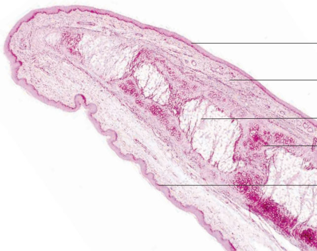
mehrschichtiges Plattenepithel (laryngeale Fläche) lockeres Bindegewebe mit elastischen Fasern und vereinzelt mukösen Drüsen univakuoläres (weißes) Fettgewebe Kehlkopfkorpel (elastisch) mehrschichtiges Plattenepithel (linguale Fläche) Kehldeckel, Hund. Elastika-Färbung, Vergr. 40fach.